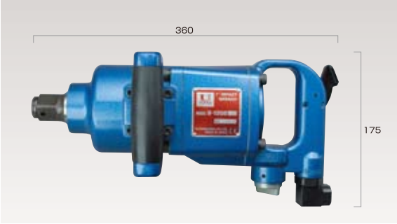
25.4mmショートインパクトレンチ (ピンレスワンハンマー方式)正逆3段切り替え調整付き ※受注生産となります。 ● ¥113,800 (税抜き価格)