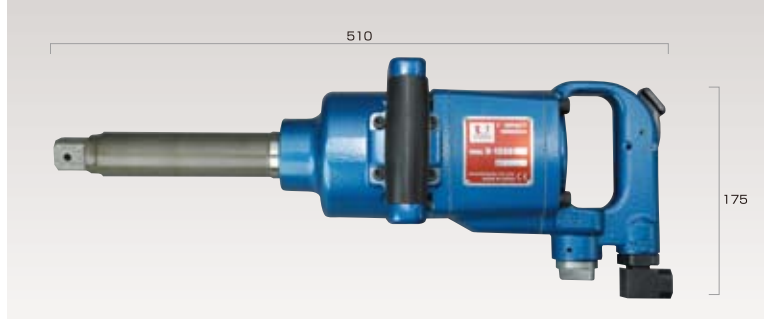
25.4mmインパクトレンチ (ピンレスワンハンマー方式)正逆3段切り替え調整付き ● ¥113,800 (税抜き価格)