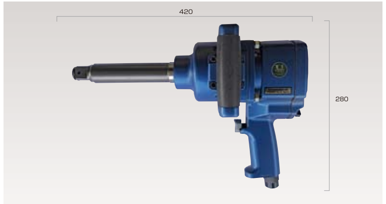
25.4mmロングインパクトレンチ (ピンレスワンハンマー方式)正逆3段切り替え調整付き ※受注生産となります。 ● ¥113,800 (税抜き価格)