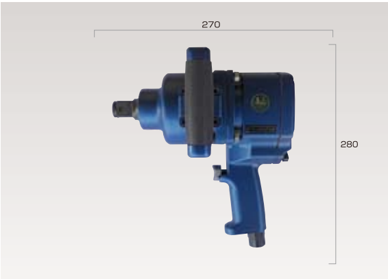
25.4mmショートインパクトレンチ (ピンレスワンハンマー方式)正逆3段切り替え調整付き ※受注生産となります。 ● ¥113,800 (税抜き価格)