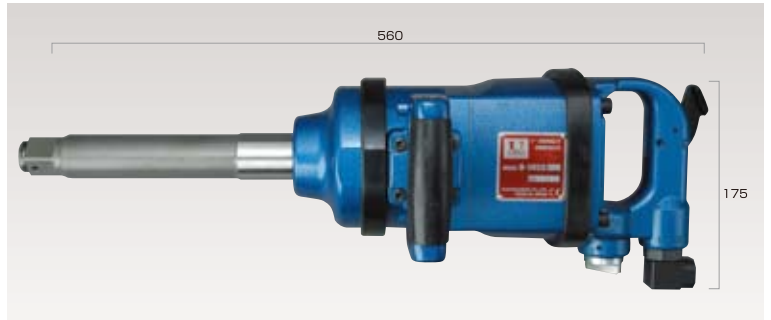
25.4mmインパクトレンチ (ピンレスワンハンマー方式)正逆3段切り替え調整付き ● ¥140,000 (税抜き価格)