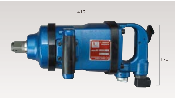
25.4mmショートインパクトレンチ (ピンレスワンハンマー方式)正逆3段切り替え調整付き ※受注生産となります。 ● ¥140,000 (税抜き価格)